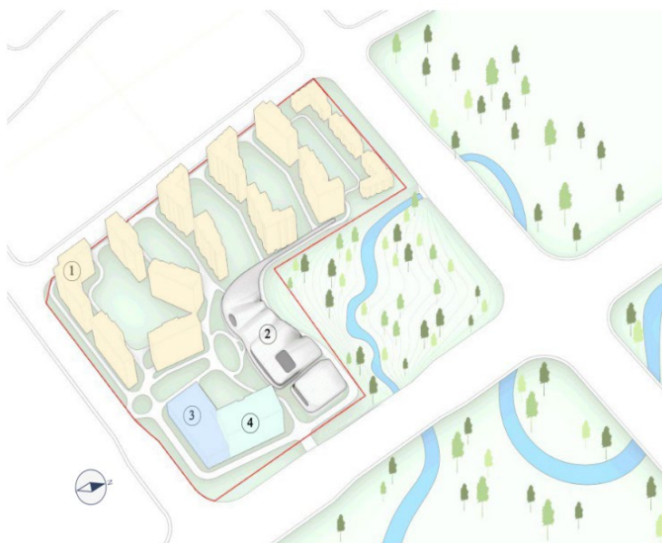
в) Схема генплану