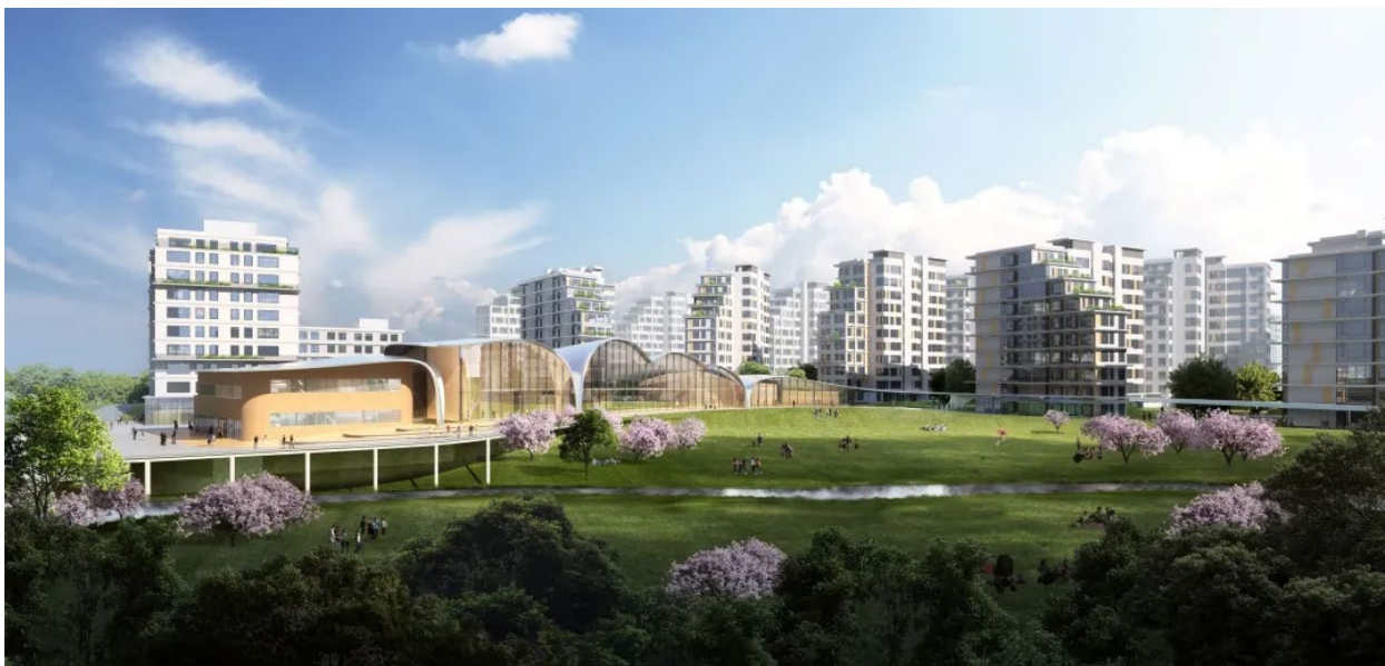
а) Загальний вигляд