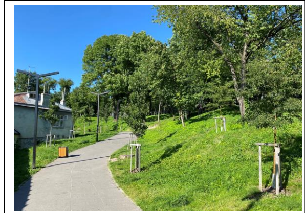
Рис. 3. Сад Живої Пам'яті, м. Львів.

Ще одним прикладом втілення ідеї ідентичності є Сад Живої пам'яті Героїв АТО, що у Львові (рис. 3). Сад був створений у жовтні 2021 року до Дня захисників України. Він розташований вздовж алеї, що сполучає Меморіал Героїв Небесної сотні з Високим Замком та входить в буферну зону Львова. Він налічує 96 дерев серед яких – райські яблуні, декоративні груші, глоди, горобина та інші. Особливість цього саду у тому, що кожне дерево підписане і присвячене воїну, що віддав життя за незалежність нашої держави [9].