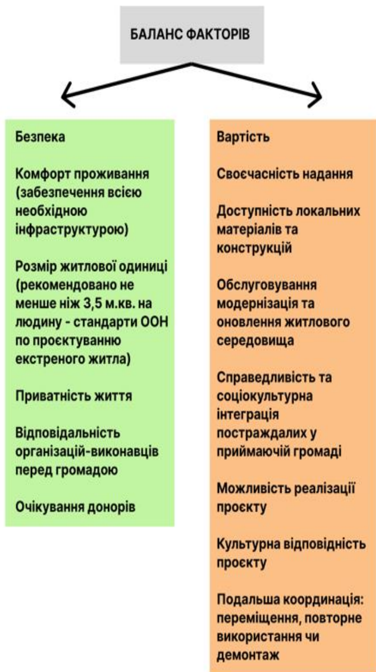
Таблиця 1. «Баланс факторів тимчасового житлового середовища»

Разом з цим, огляд наявного українського досвіду показав відсутність інструментів для об'єднання дій проєктувальників, громади та уряду в одну стратегію тимчасової житлової політики, та як наслідок унеможливлення об'єктів тимчасового укриття та житла задовольнити всі необхідні (соціальні, культурні та інфраструктурні) потреби мешканців.