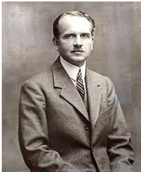
Рис. 1. Ришард Малаховський (фото з родинного архіву) [3]

Основна частина. Перу - одна з найцікавіших в культурному та археологічному плані країн, світовий лідер туризму. Відправною точкою для знайомства є її столиця Ліма, в якій багато визначних споруд 20 ст., включно з ансамблем будівель центральної площі Пласа де Армас, спроектовані нашим земляком. Такі архітектурні пам'ятки, як Палац Архієпископа (фасад), будівля Конгресу, Національний клуб, Муніципальний театр, Урядовий палац Перу (фасад), Будинок перуанської культури, Будівля Рімака, Палац Юстиції, Будівля національної спілки інженерів, Косигнаційного фонду, Банк Італії (нині Кредитний банк), Посольство Колумбії є знаковими будівлями Ліми і емблемами міського бачення Ришарда Малаховського, більш відомого як Рікардо Малаховський (рис. 1). Він також є автором проєктів реконструкції головної авеню Пасео-де-ла Республіка та площі Дос де Майо, будівель соціального, культурного та релігійного призначення, чисельних резиденцій в Лімі та приморських курортів, житлових масивів, комерційних та спортивних об'єктів в Перу, Еквадорі та Уругваї. [10]