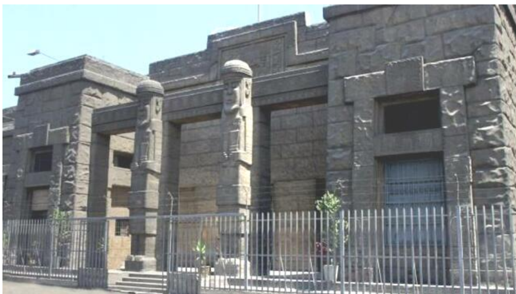
Рис. 8. Національний музей перуанської культури, 1924. [14]

Особливий випадок - Національний музей перуанської культури, мова якого натхненна естетикою культури Тіауанако (рис. 8). Будівля радикально відрізняється від класичного Малаховського, випускника паризької Школи Мистецтв. Контраст стає ще помітнішим, оскільки будівля розташована поруч із однією з його найбільш доктринально інноваційних взірців перуанського урбанізму, площі Dos de Mayo. «Насправді Малаховський проголошує цю хамелеонну здатність архітектури, яка може мати національний одяг і внутрішню західну просторовість», – пише Луденя. Ця багатогранність мов, між власним і іноземним, окремих і універсальним, робить роботу Малаховського фундаментальним внеском в історію архітектури. [14]