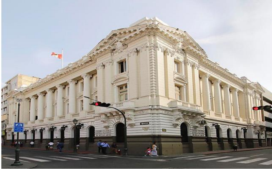
Рис. 6. м. Ліма, будівля Косігнаційного фонду, 1913 (сучасна Національна Школа Мистецтв) [5]