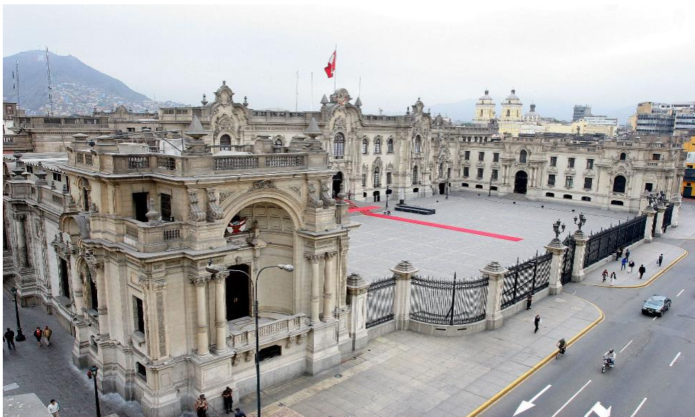
Рис. 7. м. Ліма, Урядовий Палац, 1938. [10]

У 1936 р. Малаховському було довірено завершити проект будинку Уряду Перу (рис. 7). Він запропонував П-подібну будівлю, в якій бічні конструкції, оточуючи великий двір пошани, де щоденно проводиться зміна караулу, виходить на Plaza Mayor. На відміну від попередніх будівель архітектора, у цій роботі можна ідентифікувати архітектурні елементи, які використовувалися в архітектурі бароко в Лімі, такі як відкриті фронти та декоровані пілястри. Він продовжує використання колон гігантського ордеру в два поверхи палацу, але вводить легкий орнамент навколо отворів. Бічні конструкції мають здвоєні колони, що підтримують арки, під якими з обох боків розміщено парапетний балкон.