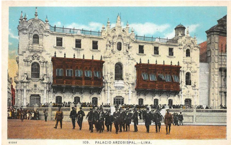
Рис. 5. м. Ліма, фасад Архієпископського палацу, 1924 р. [14]

Парижа: запровадження нової просторовості площ, проспектів та бульварів міста, їх впорядкування, планування, гігієна та благоустрій. «... вулиця стає великою сценою, на якій вирішується громадське та політичне життя країни, - стверджує Луденья. Архітектурний внесок Малаховського у модернізації Ліми був вирішальним. [14]