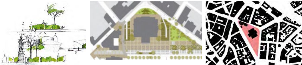
Рис. 3. Вул. Луїзенштрассе, Ганновер

Концепцію ландшафтного архітектора Камеля Луафі з Берліна було побудовано у кілька етапів будівництва. Відтоді класичний оперний театр (Hofbaumeister Laves), оточений високоякісним садовим мистецтвом. Оперну площу було озеленено. Забезпечено свободу руху по внутрішній площі та окультурена садова архітектура зі стриженими живоплотами, набережними з пісковика та газонами.