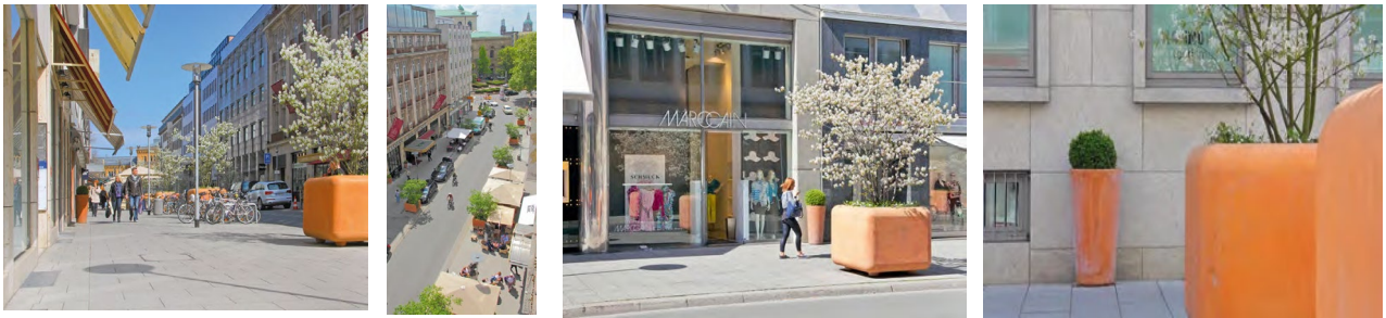
Рис. 4. Площа «Krörске», Ганновер

Ганноверський Krörске спочатку не був громадським місцем, а виступав лише як транспортна розв'язка на північному куті Оперної площі (рис.4).