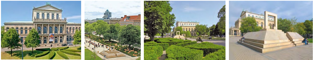
Рис. 2 Оперна площа, Ганновер, Німеччина. Період будівництва 2008 - 2013 роки.

«Оперна ініціатива», об'єднання відданих ділових людей, запропонували у 2006 році редизайн Оперної площі. Зацікавлені громадяни могли відвідати лекції та брати участь у творчому оформленні та процесі обговорення питань (рис. 2).