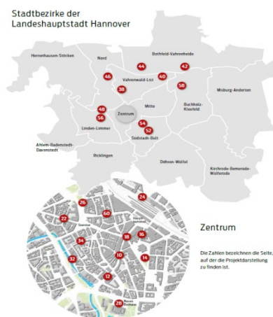
Рис. 1. Карта Ганноверу, де вказано редизайн яких громадських місць було розроблено

Наприклад, у Ганновері було розроблено масштабний покроковий план з перетворення міста який було розпочато ще в 2005 р. (рис. 1).