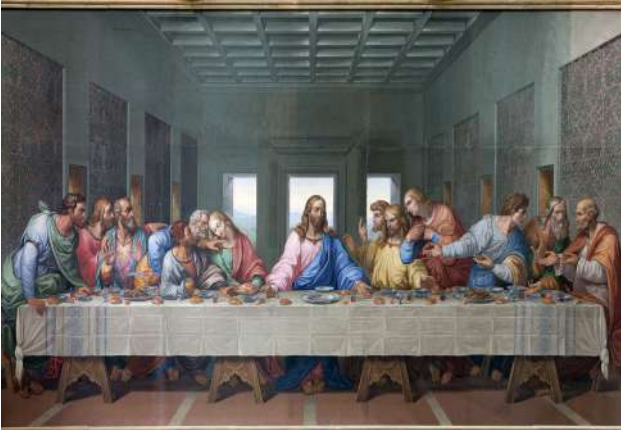
Рис. 5. Монументальний розпис «Таємна Вечеря» худ. Леонардо да Вінчі, 1495-1498 р. У Домініканському монастирі Санта-Марія-делле-Граціе у Мілані

майстрів, як Леонардо да Вінчі (рис. 5), Рафаель Санті (рис. 6), Мікеланджело Буонарротті (рис. 7), які зробили без перебільшення величезний вклад у світову мистецьку скарбницю.