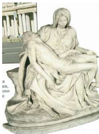
Рис. 12. П'єта у соборі Св. Петра в Римі, скульптор Мікеланджело 1499 р.