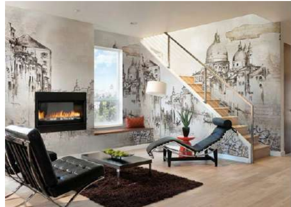
Рис. 15. Живопис в інтер'єрі сучасного житлового будинку