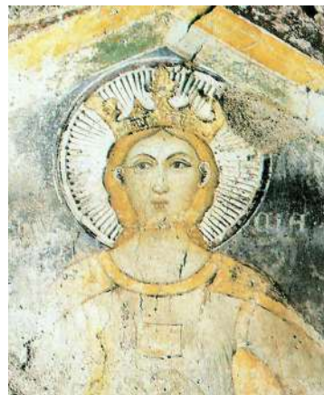
Рис. 4. Настінний розпис XIV ст. церкви Богородиці, острів Родос

В наш час, при розробці дизайн-проектів інтер'єрів житлових та громадських приміщень, також доречно використовувати орнаментальний розпис [5, с. 206 – 210]. Так, вертикальні смуги орнаменту роблять приміщення візуально дещо вищим; горизонтальні смуги ж навпаки візуально зменшують висоту простору.