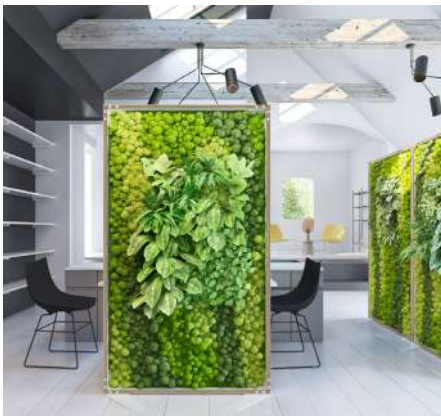
Рис. 22. Озеленення в інтер'єрі сучасного житлового будинку