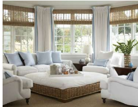
Рис. 21. Текстиль в інтер'єрі сучасного житлового будинку