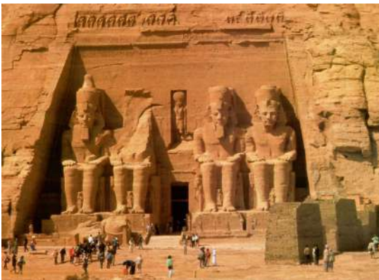
Рис. 8. Храм Рамзеса II, 1240 до РХ