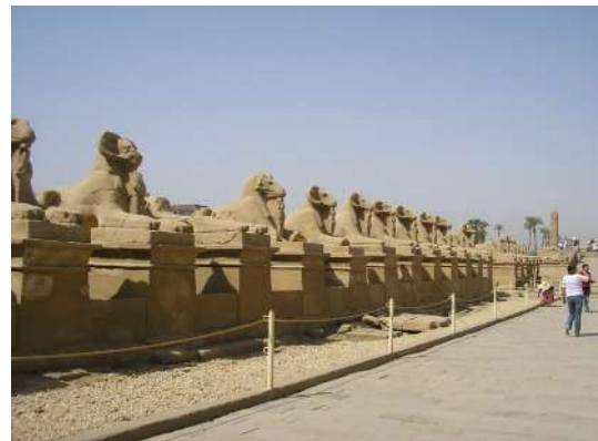
Рис. 9. Алея Сфінксів, храм Амона Ра у Карнаку ХІХ династія 1310-1200 до РХ