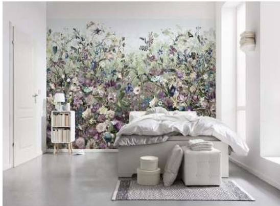
Рис. 14. Живопис в інтер'єрі сучасного житлового будинку

При вирішенні простору сучасних громадських та житлових споруд широко застосовуються скульптурні композиції. На рис. 17 наведено можливий варіант застосування прийому «Трансформації» - стилізації несучих колон приміщення у сучасне трактування античних кариатид. Дані скульптури вдало доповнюють інтер'єр житлового приміщення, витриманий у класичному стилі.