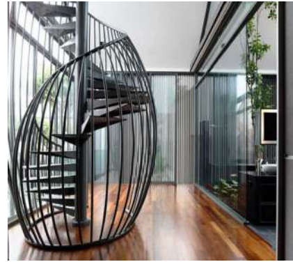
Рис. 19. Метал в інтер'єрі сучасного житлового будинку