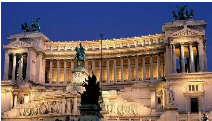
Рис. 13. Ансамбль Віторіано у Римі, 1885 р.

На другому ярусі споруди встановлено чотири тріумфальні колони з бронзовими статуями Вікторій. Статуї «Області Італії» на фризі комплексу Віторіано символізують шістнадцять італійських областей. Цікавим є те, що над їх створенням працювали скульптор із різних областей Італії.