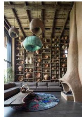
Рис. 23. Освітлення в інтер'єрі сучасного житлового будинку

Синтез мистецтв в архітектурі також може проявлятися через застосування високохудожніх вітражних поверхонь. Так, на рис. 18 наведено можливий варіант вирішення літньої веранди садибному будинку із застосуванням прийому «Конструктивної єдності». Веранду, прибудову до приватного будинку, пропонується перекрити огорожуючою конструкцією з дерев'яного каркасу і заповненням зі скла (вітражне скло із флористичними малюнком). Це дозволило створити в садибному будинку додатковий простір із особливою літньою атмосферою для відпочинку та роботи упродовж року.