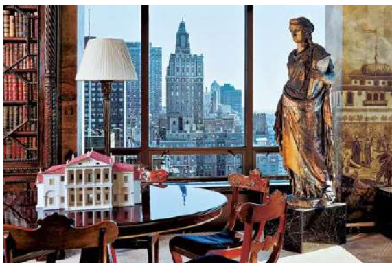
Рис. 16. Скульптура в інтер'єрі сучасного житлового будинку