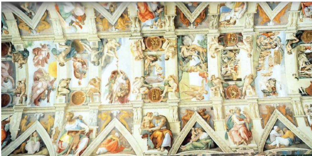
Рис. 7. Фреска склепіння Секстинської капели, худ. Мікеланджело, 1508-1512 р., Ватикан