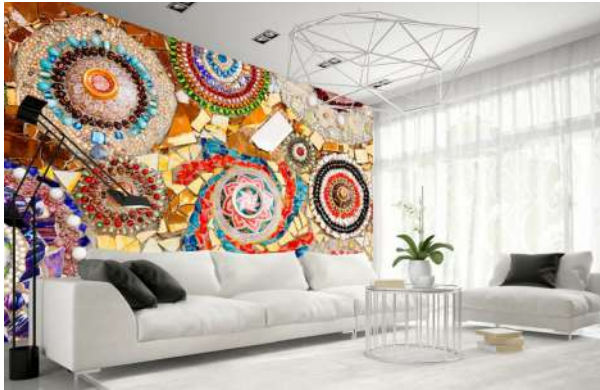
Рис. 20. Кераміка в інтер'єрі сучасного житлового будинку