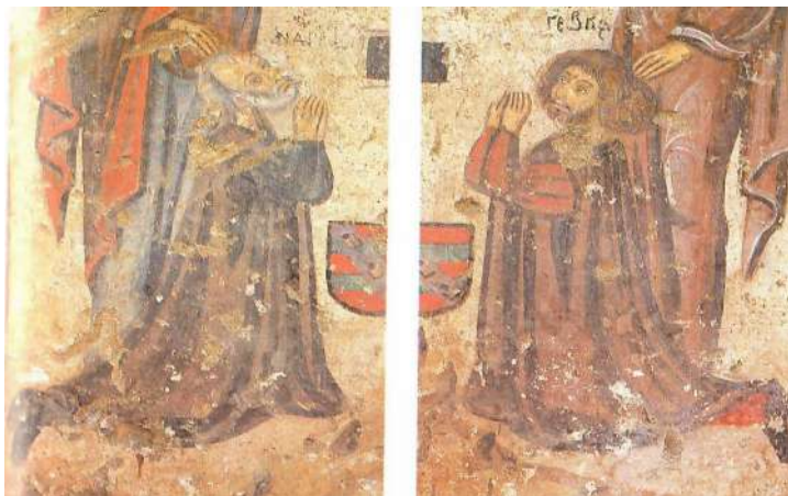
Рис. 3. Фрагмент розпису XVII ст. церкви Св. Спиридона на острові Родос, Греція

культових споруд на острові Родос (рис. 3, 4). Темати розписів часто ставали сюжет із Грецької міфології; символіка в орнаменті багато в чому перепліталась із Єгипетською: в орнаментальних композиціях можна побачити як середземноморські мотиви, так і широко розповсюджені єгипетські символи, такі як лотос, пальмове гілля тощо.