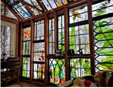
Рис. 18. Скло в інтер'єрі сучасного житлового будинку