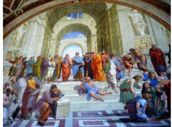
Рис. 6. Фреска у Станці делла Сеньятура у Ватикані, худ. Рафаель, 1509-1511 р. Нині музей Ватикану