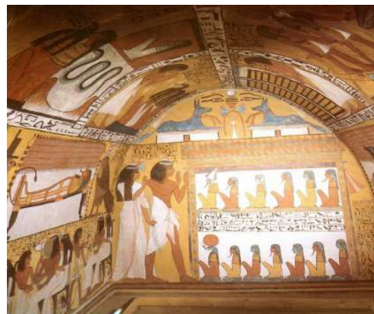
Рис. 1. Розпис гробниці Амона, сина Рамзеса III, долина Цариць Рис. 2. Розпис у нікрополі Дейр ель Медини

Знання про властивості кольору сьогодні дають змогу митцям успішно використовувати його в живописі, дизайні, архітектурі. Дослідженнями щодо впливу кольору на людину займалось чимало видатних діячів минулого, серед яких: Арістотель, Леонардо да Вінчі, І. Ньютон, Й. В. Гете, Н. В. Ломоносов, І. П. Павлов, Іттен Йоганес, та інші.