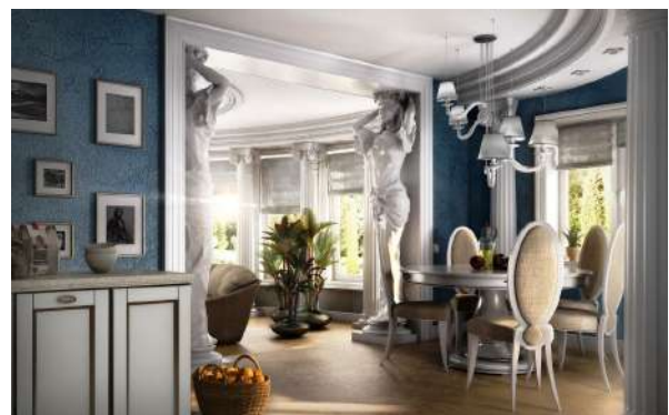
Рис. 17. Скульптура в інтер'єрі сучасного житлового будинку