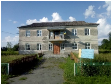
Рис. 1. Клуб та бібліотека с.Оглядів Червоноградського району

день навіть нема сталих затверджених схем планування фельдшерсько-акушерських пунктів і амбулаторій сімейної медицини, які б враховували сучасний практичний досвід експлуатації об'єктів сільської медицини, збудованих протягом останніх десяти років; забезпечували найкоротші терміни будівництва та були максимально дешевими в реалізації (Гнесь Л.Б.). Відсутність відповідного рівня спеціаліста у громаді спровокована з одного боку житловою проблемою, а з іншого боку соціальною. Амбулаторія місцевої медичної будівлі повинна мати не лише приміщення для надання медичної допомоги, але й передбачати можливість житла для її працівників.