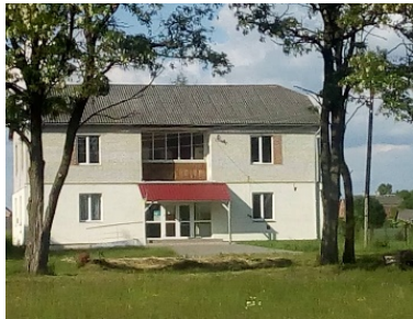
Рис. 4. Амбулаторія с. Оглядів Червоноградського району

габаритів будівлі, що забезпечують нормальне функціонування і доцільність сприйняття; пошук композиційного рішення, що виділяється виразністю та гармонійністю у конкретній місцевості.