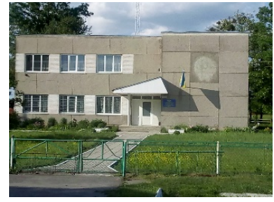
Рис. 6. Адмінбудинок с. Оглядів Червоноградського району

Досвід забудови українських сіл підтверджує важливість детального аналізу кожного окремого поселення з врахуванням всіх його особливостей. Дослідження та аналіз сіл західної України дає можливість поділити на їх групи. Поселення, які займаються сільським господарством, та розвиваються за його рахунок. Зазвичай це віддалені від урбанізованих просторів села. Села – супутники великих міст, що входять у склад об'єднаної міської громади за рахунок активної урбанізації та субурбанізації перетворюються на спальні райони, житлові осередки. Такі поселення втрачають властивість займатись сільським господарством, що відповідно, впливає на забудову та розвиток села. Села – туристичні, або поселення з сприятливими кліматичними умовами для розвитку туризму. Села Капрат, Закарпаття, Волині. Села – з «прикордонною» локацією які по причині власного розташування до кордону з сусідніми державами є житловою локацією для громадян, що працюють за межами держави, або обслуговують транспортну мережу. Наведені групи поселень дають можливість визначити напрямок підбору забудови, що буде вирішувати потребу у обслуговуванні. Враховуючи як місцеве населенні так і транзитних абонентів.