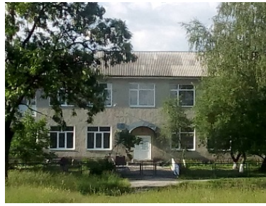
Рис. 5. Дитсадок с. Оглядів Червоноградського району