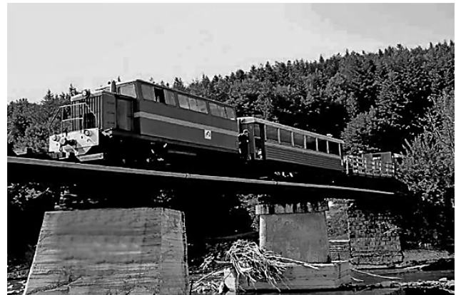
Рис 5. – Австрійські мости-віадуки у смт. Ворохта