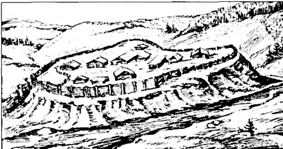
Рис. 2 – Реконструкція слов'янського граду в V ст.н.е.

Етап Прикарпатських градів. На цьому етапі трансформується архітектура стародавніх Прикарпатських міст. Перехід від побудови первісного городища до укріплених градів додало могутності для становлення Галицько-Волинського князівства (Рис 2.)