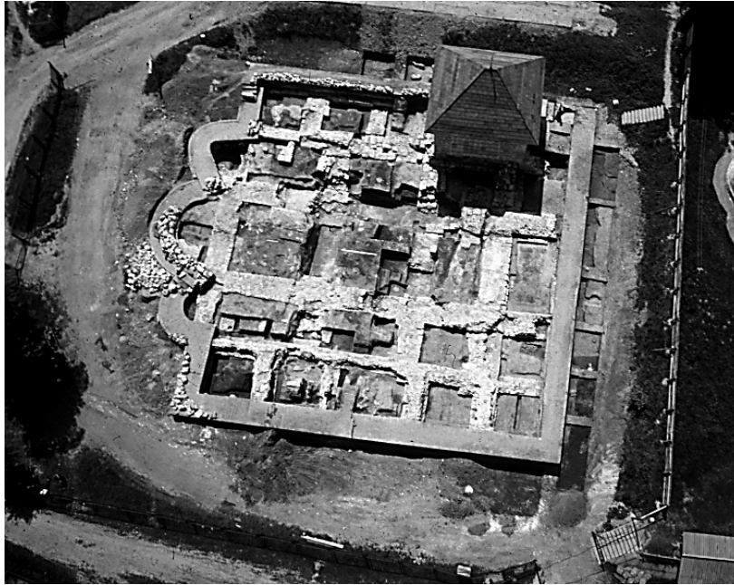
Рис.3 – Фундамент Успенського собору в Галичі

Загальні риси для архітектури Прикарпаття княжого етапу такі: вплив західної архітектури; поєднання східного, візантійського, і західного, романського стилів; збереження візантійського типу забудови храмів. До наших днів зберігся храм Святого Пантелеймона, що знаходиться в селі Шевченкове. Його первісні мури, споруджені із тесаного каменю, збереглись до висоти будівлі попри три великі руйнації храму.