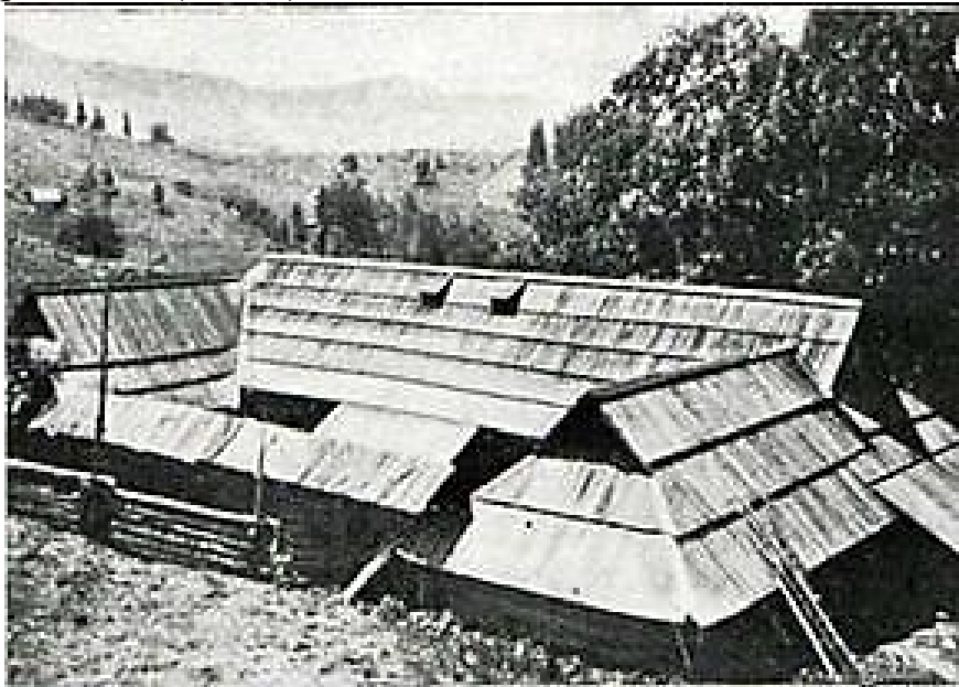
Рис. 4 – Гуцульська хата-гражда

Попри значний вплив на архітектуру західних традицій на Прикарпатті будуються дерев'яні храми. Автохтонне населення Прикарпаття споруджувало із дерева не тільки храми, а й власні будинки та господарські споруди. Особливістю таких споруд було те, що майстри будували без єдиного цвяха та будь-якого креслення (Рис. 4).