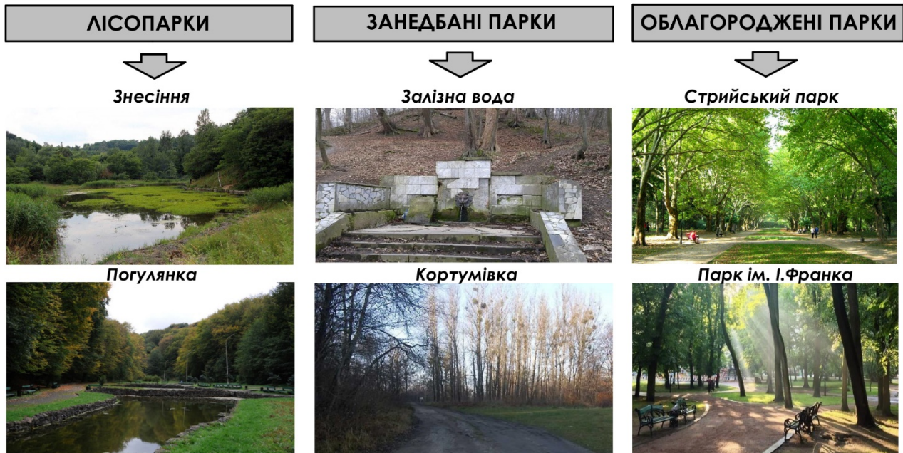
Рис. 5. Вплив характеристик озеленення на медійність парків Львова.

Медійність зелених зон міста є динамічною, оскільки пов'язана зі зміною пір року [13]. Змінюється кольорова гама, насиченість, рослини з'являються або зникають, змінюючи відповідно настрій середовища та його сприйняття.