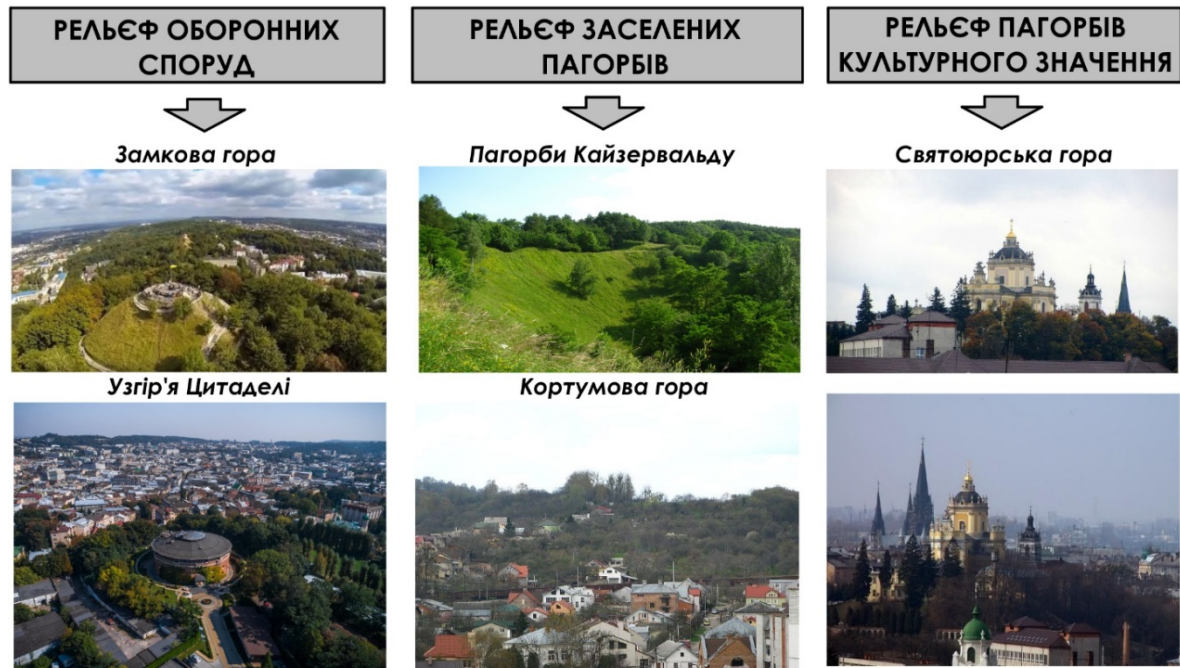
Рис. 3. Вплив характеристик рельєфу на медійність пагорбів Львова.

Пластика рельєфу впливає на сприйняття середовища людиною. Наприклад, рівнинні ділянки (гора Святого Яцка) викликають спокій, іноді навіть нудьгу, в той час, коли стрімкі обірвані схили (Лиса гора) асоціюються з небезпекою чи навіть страхом [19]. Крутизна схилів, характер рельєфу, його експозиція обумовлювали медійність пагорбів впродовж історії Львова (рис.3) [16]. Замковій горі та узгір'ю Цитаделі властиві круті, неприступні схили, що стало основою для використання цих вершин як місця для оборонних стратегічних об'єктів. Вигідне положення для експозиції рельєфу займає Святоюрська гора, тож історично її медійність пов'язана із сакральністю, щоб храм Божий був постійно на видноті у мешканців. Кортумовій горі та пагорбам Кайзервальду властиві рівнинність, камерність, закритість, тож першочергово на них виникали резиденції та вілли, які давали їх власникам змогу сховатися від міського шуму.