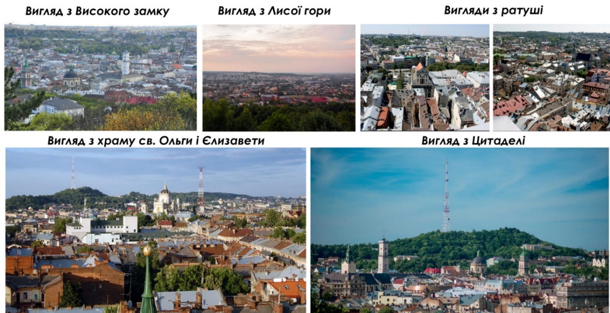
Рис. 6. Панорами з найвідоміших оглядових точок Львова.

сутності місцевості. Для цього було створено багатовимірну матрицю зв'язків (рис.7) за зразком Габреля М.М. [6].