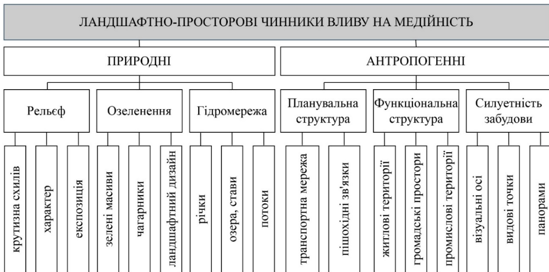
Рис. 1. Ландшафтно-просторові чинники впливу на медійність архітектури та міських просторів

впливає підсвідоме бажання людини до підкорення вершин та споглядання панорам з висоти.