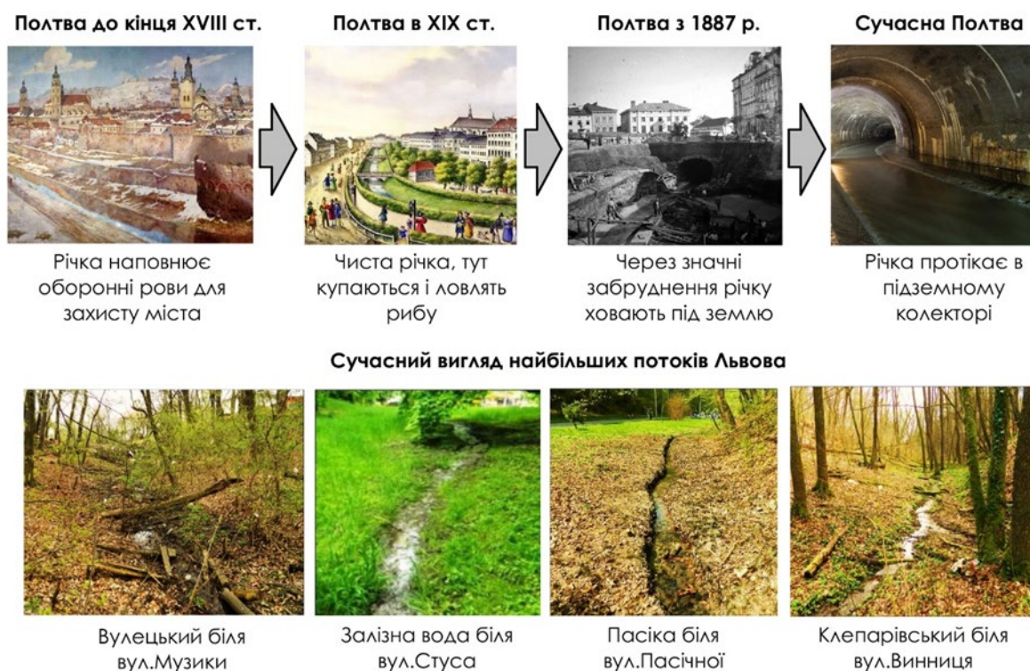
Рис. 4. Еволюція медійності річки Полтва та сучасний вигляд її потоків.

прийнято рішення про поховання русла річки у підземному колекторі (рис.4). Полтва у свою чергу має кілька потоків, найбільші з яких Пасіка, Залізна Вода, Клепарівський та Вулецький потік. До гідромережі Львова також відносяться стави та озера. В процесі розбудови міста їх кількість систематично зменшилась і на сьогодні для медійності Львова найбільше значення мають Піскові озера, озеро в Стрийському парку, стави Погулянки, озера в «Горіховому гаю», озеро Стосика, Левандівське озеро. На сьогодні в межах Львова немає чітко вираженої гідромережі, тому цей чинник має фрагментарну дію на медійність просторів міста.