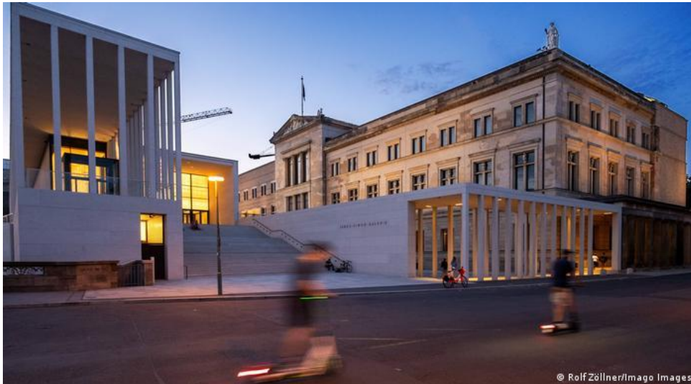
Рис. 4 Музейний острів в Берліні

Подібний підхід для розширення існуючих та концентрації нових музеїв використав Девід Чіпперфільд, створюючи галерею James Simon Galerie, яка офіційно передана Національному музею Берліна. Нова споруда є продовженням архітектури форуму Штюлера А. і новим входом на Музейний острів.