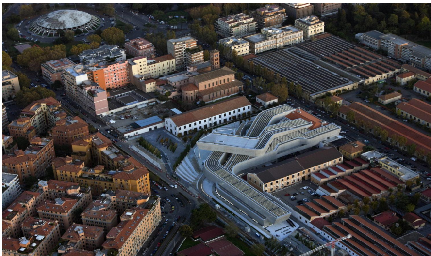
Рис. 2 МАХХІ Національний музей мистецтва в Римі (арх. Заха Хадід)