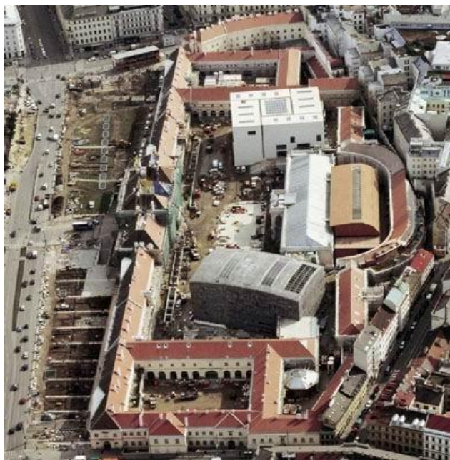
Рис. 3 Музейний квартал у Відні

Враховуючи культурну вартість історично міського середовища, в якому і споруджувались перші національні мистецькі музеї, концентрація скарбниць загально-національного значення видається найдоцільнішою саме у такому середовищі в культурно естетичному і емоційному плані.