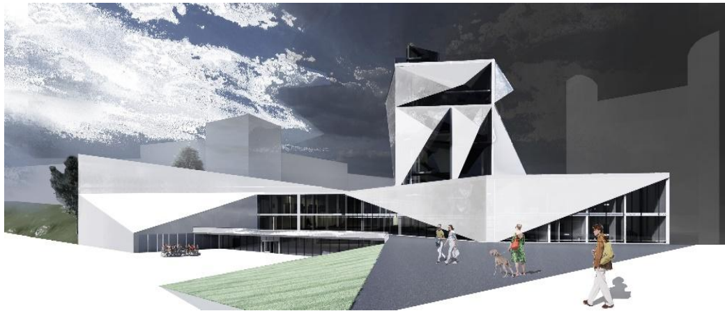
Рис. 6 Авторська розробка нової частини НХМУ