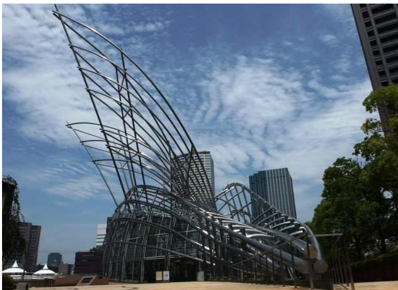
Рис.5 Художній Національний музей в Осака