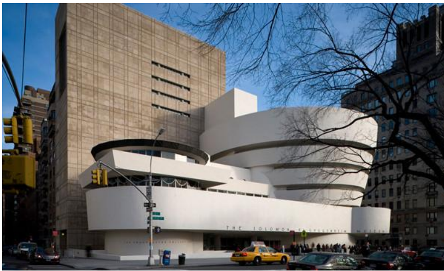
Рис.1 Музей Соломона Гуггенхайма в Нью-Йорку (арх. Ф. Л. Райт)

Архітектура музейної споруди – це не лише фізична оболонка для збереження і представлення колекцій, яка має бути функційною і зручною для експозиції, наукової дослідницької роботи та ін. Архітектура впливає на формування комунікації всередині музею, де архітектурні елементи можуть підвищувати ефективність експозиції. Але насамперед взаємодія музейної аудиторії з музеєм розпочинається з вражень від художньо-естетичного образу споруди та прилеглої території, що стають інтродукцією реципієнта у світ культури і мистецтва, відмінний від повсякденності міського оточення. Саме архітектура музею налаштовує відвідувача на очікування винятковості, особливих пізнавальних вражень від експозиції у незвичній споруді.