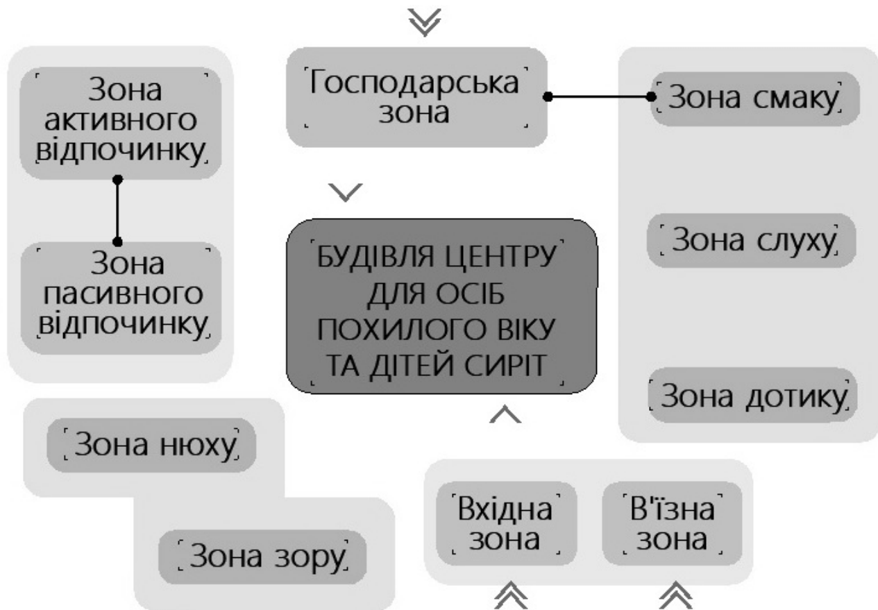
Рис. 1. Схема функціонального зонування території центру для спільного тимчасового перебування осіб похилого віку та дітей-сиріт.

Центр об'єднаних поколінь – це заклад, який зможе задати новий формат у моделі подібного роду закладів для спільного проведення дозвілля дітей та осіб похилого віку.