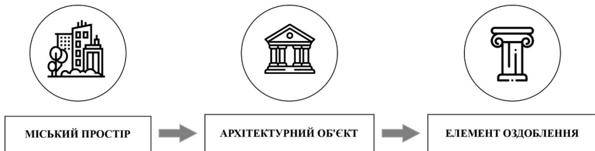
Рис.1. Ієрархічні рівні дослідження медійності

Основна частина. Специфікою даної теми є вивчення інформаційної сутності архітектури та просторів через її матеріальний прояв. Дослідження передбачається провести на трьох ієрархічних рівнях (рис.1) для оптимізації вибору методів.