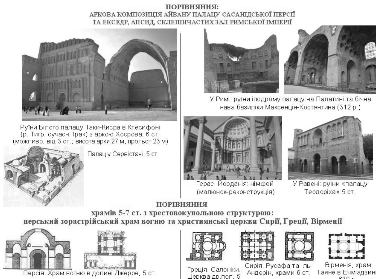
Рис. 3. Порівняння архетипів ойкуменічної архітектури: композиційних розпланувальних та об'ємно-просторових форм та декоративних деталей архітектури Стародавньої Персії та Середземномор'я. Приклади хрестової дворової композиції, ніш-екседр, склепінчастих зал, аркад, хрестовокупольних храмів.

емігрантів-вчених – греків і латиняни, сирійців і вірмен, навіть індуців і китайців.