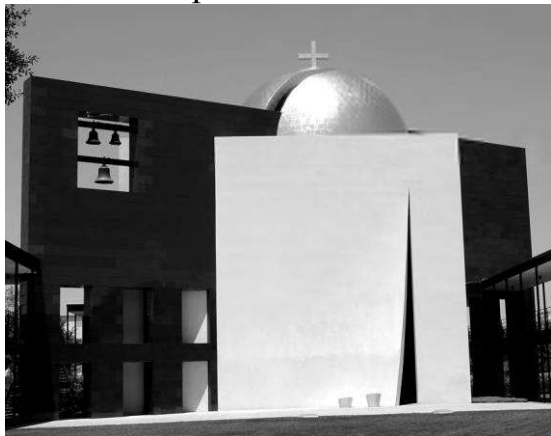
Рис. 3. Філіп Джонсон, св. Василя, 1997, св. Університет Томаса, Х'юстон

Ліцин - вважається центром душпастирської опіки сільських жителів - в даний час приваблює близько мільйона паломників щороку.