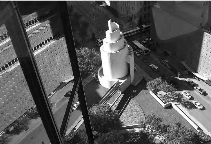
Рис. 1. Філіп Джонсон, каплиця Подяки, 1977, Даллас

архітектурної школи Сен-Люк у м. Турне, Бельгія. Взірцем для твору на фоні африканської природи, стала базиліка св. Петра в Римі [11; 12].