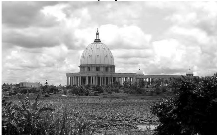
Рис. 4. П'єр Фахурі, Базилика Богоматері, 1985–1990, Ямусукро, Кот-д'Івуар

Його особливе положення серед польських святих місць зумовлене специфікою польської релігійності, зосередженої на марійських обрядах та культурах [18]. Поширення цього типу релігійності, з якою владу було практично неможливо боротися, стало реакцією на широку систему репресій та обмежень, властивих комуністичному режиму. Концепція захисту віри, створена в цих умовах предстоятелем Стефаном Вишинським, передбачала розвиток марійської релігійності як універсальний як для сіл, так і для міст. Вісімдесяти роки ХХ століття, період воєнного стану в Польщі та мобілізація комуністів на захист системи влади, підтвердили правильність цього вибору.