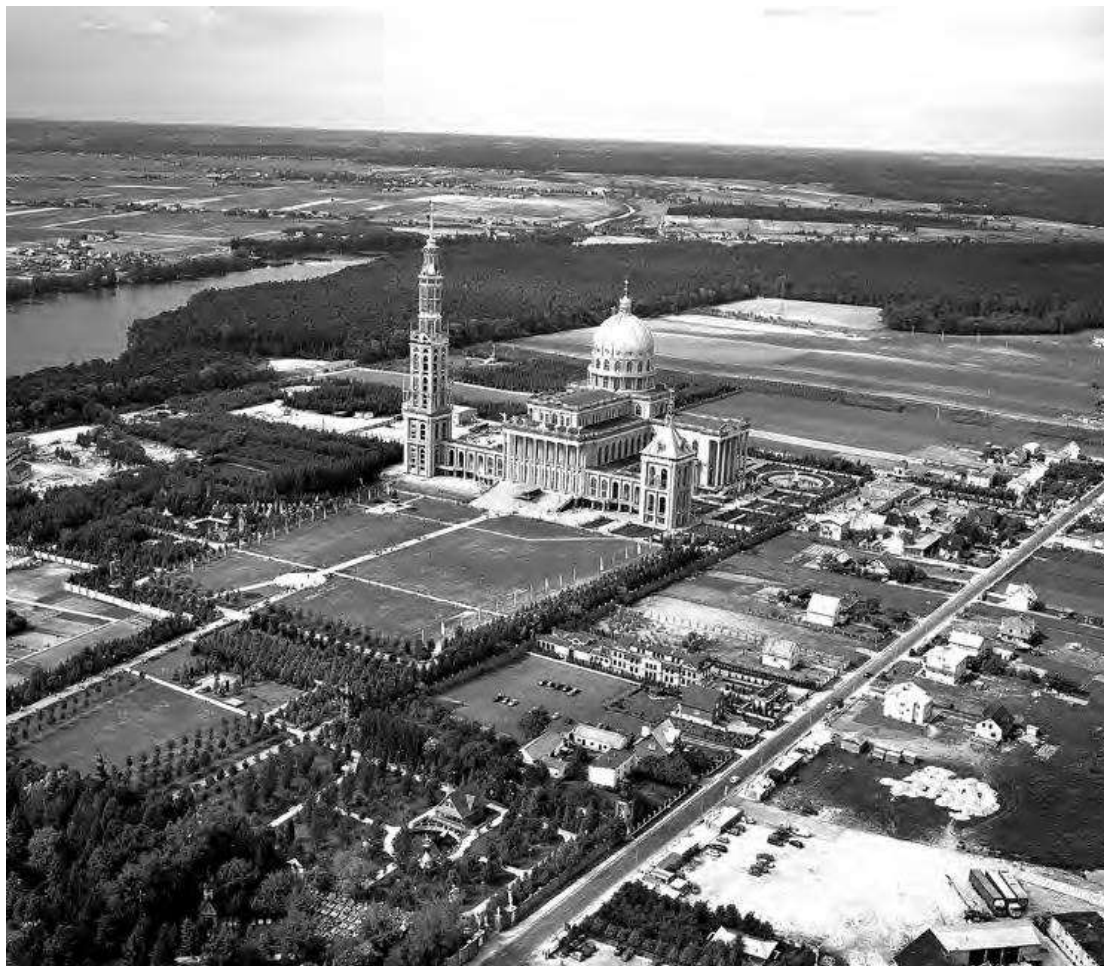
Рис. 5. Барбара Білецька, Маріанська святиня, Ліцин, Польща, 1994–2004

Тонкість колон, жовта клінкерна цегла та мотив зернових колосків, що повторюються у всьому храмі, за словами автора проекту Барбари Білецької, - посилення на сільськогосподарський характер ліченської землі.