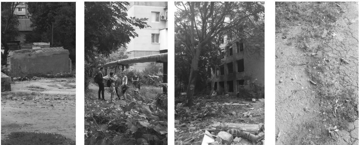
Рис. 1. Типові проблеми одеських пострадянських дворових просторів

місцевої влади в українських містах та селищах було запроваджено заходи із покращення внутрішньодворових просторів. Зазвичай воно обмежувалось заміною зруйнованого дорожнього покриття, налаштування зовнішнього освітлення, встановлення типового сучасного дитячого грального комплексу, розташування урн та лавок, подекуди тренувальних комплексів з ворк-ауту та столів для гри у настільний теніс. Системних змін прибудинкові території не отримали. Ці заходи із покращення представляли собою несистемну роботу і не враховували реальні потреби мешканців. Часто позитивні перетворення являли собою частину передвиборчої кампанії чергового кандидата до органу влади.