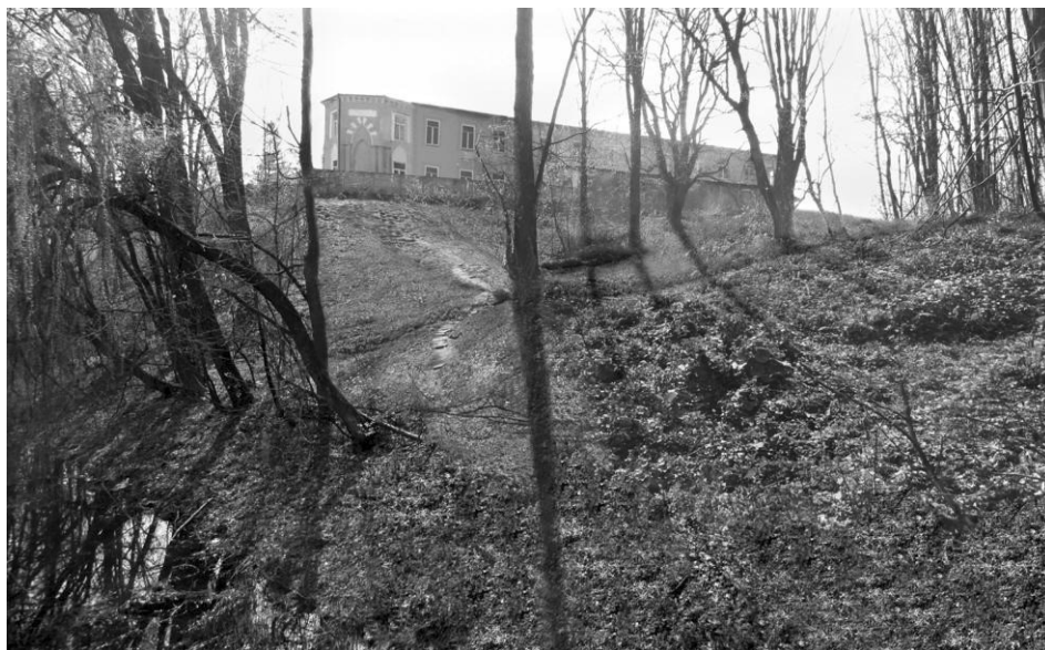
Рис. 3. Вигляд на замковий комплекс із північно-східного боку (фото 2017 р.) [3]

Проведений аналіз картографічних матеріалів, їх співставлення з фрагментами актуальних карт Google maps, а також результатами детального натурного обстеження території Рожнятівського замкового комплексу, дозволив визначити масштаб втрат і змін, що відбулися. Зокрема, встановлено, що значна частина території замкового подвір'я забудована спорудами різного функціонального призначення пізніших періодів: