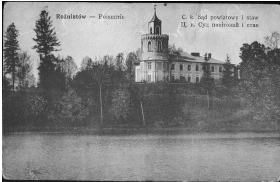
Рис. 2. Вигляд на замковий комплекс із північно-східного боку (поштівка 1906 р.) [9, 14, 15]