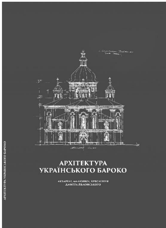
Рис.2. Обкладинка видання «Архітектура українського бароко: акварелі, малюнки, креслення Дмитра Яблонського», 2019 року

змістовно переносити на папір інформацію про архітектурні споруди та деталі. Всі ці матеріали набули з часом художню цінність самі по собі. Матеріали першого блоку видання можуть застосовуватись при викладанні малюнку та акварельної техніки для архітекторів, а також для академічної роботи з архітектурного креслення, відмивок пам'яток архітектури на перших курсах архітектурних вузів. У другий блок включено матеріали з альбому «Портали в українській архітектурі», 1955 року видання, що були перекладені українською мовою. Це авторська узагальнююча стаття про архітектуру порталів Українського бароко, а також 33 таблиці креслень порталів та анотації-коментарі до них. Науково-дослідницькі матеріали другого блоку не втратили актуальності в наш час і можуть бути використані дослідниками української архітектурної спадщини та фахівцями-реставраторами в своїй професійній роботі.