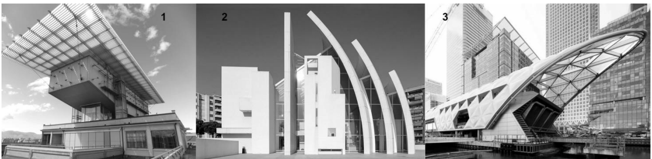
Рис. 1. Приклади архітектури, де модерністська мова використовується без застосування принципу «форма слідуює функції» (1 – Пінакотека Аньеллі, 2002 р., арх. Р. Піано, Турін; 2 – «Ювілейна церква», 2003 р., арх. Р. Меєр, Рим; 3 – Залізнична станція Canary Wharf, 2015 р., арх. Н. Фостер, Лондон)

Крім зазначених вище міркувань, для архітектурної теорії модернізм та модернізм тісно пов'язані із принципом «форма слідуює функції» [8]. В цьому сенсі, архітектура, що виникла після спаду постмодерністської хвилі продемонструвала надто велику різноманітність вирішень, в тому числі і тих, в яких дотримання цього принципу повністю відсутнє (Рис. 1).