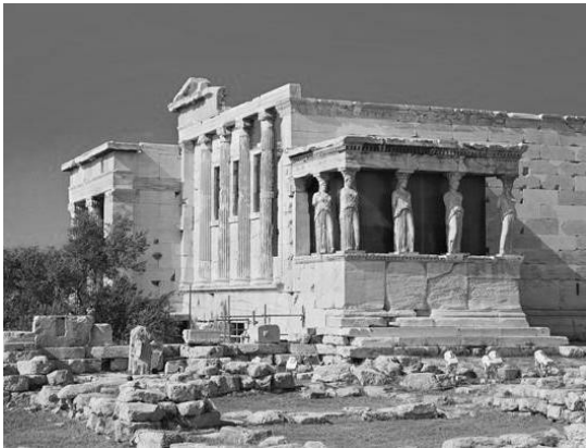
Рис. 1. Храм Ерехтейон. Афіни.