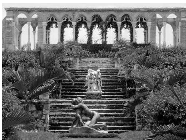
Рис. 9. Фрагмент палацово - паркового ансамблю. Версаль. Архітектор Андре Ленотр. 1682 р.

http://art-labirint.msk.ru/versal-park-foto.html