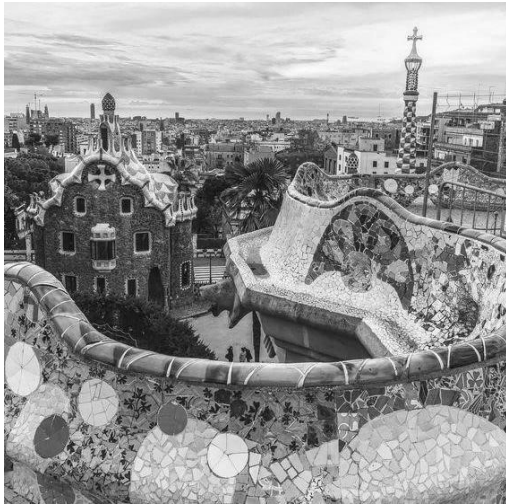
Рис 5. Вид із однієї площадки в парку Гуель. Барселона. Архітектор Антоніо Гауді. Дата заснування: 1900 - 1914 р.

Яскравим прикладом синтезу мистецтв може слугувати стиль модерн, який виникає в контексті декоративно-прикладних, художніх мистецтв, літератури з просторовою формою. Так, наприклад, парк Гуель архітектора Гауді виступає декорацією до прогулянки, яка розкривається у таких прийомах, як мозаїка, скульптура, пластичні форми конструктивних елементів, які сприймаються у визначеній послідовності (Рис.5., Рис. 6.).