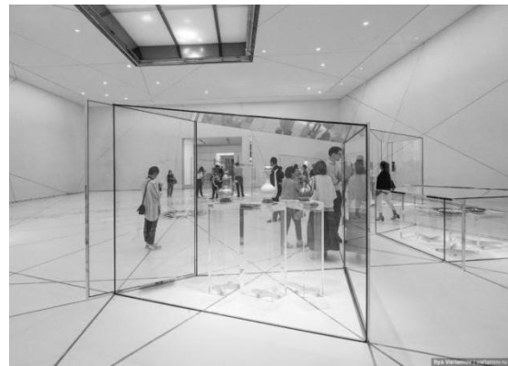
Рис. 8. Один із експозиційних залів Лувру. Абу-Дабі. Архітектор Жан Нувель. 2017 р. https://varlamov.ru/2879262.html

Декоративне оформлення подій архітектурою можна прослідкувати і на прикладі Версальського парку створеного Андре Ленотром. Основні напрямки, алеї, перетинається у сприйнятті елементами, які відображають різні смисли і несуть різні емоційні навантаження. Це і фонтани, озера, канали, статуї, ландшафтні декорації, відкриті площадки, які змінюються під час руху людини і, таким чином, створюють естетично виразний простір, що вражає і зацікавлює до взаємодії з середовищем. Шлях, який долає відвідувач, хоча він визначений основною прямою, насичений емоційними враженнями, які змінюються під час руху. Шервинський стверджує: “Версаль у виключній повноті свого впливу дає зразок найвищого прояву прийомів перспективи, покладених в основу всього паркового комплексу, а відкриваючи далі в осьовому напрямку, створює враження безмежної глибини простору [19]”. В такому випадку, простір зацікавлює людину рухатися у визначеному напрямку акцентуючи увагу на орієнтир. Також парк вміщує більш камерні простори, призначені для