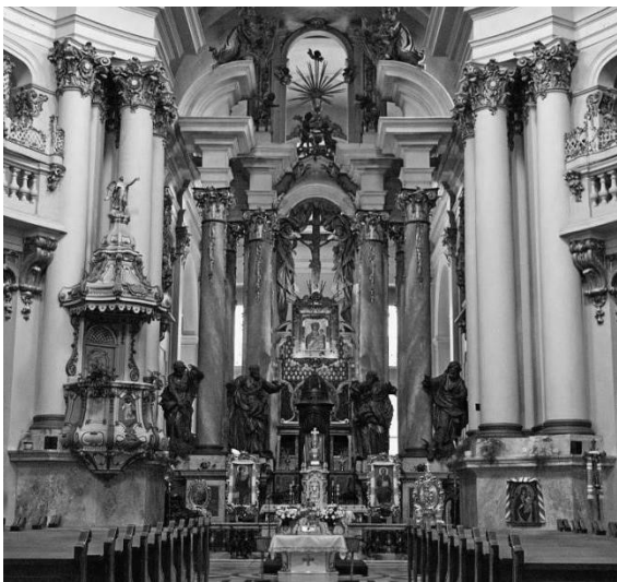
Рис. 3. Інтер'єр собора Святого Юри. Львів.

На відміну від архітектури давньої Греції, стиль Бароко вирізняється насиченістю архітектурними прийомами, які виникають в контексті різних мистецтв, це і скульптура, і декоративно-прикладні, художні мистецтва, що доповнюються тимчасовими, наприклад, як проявлення динаміки простору за рахунок світла (Рис. 3., Рис. 4.). В парадних інтер'єрах архітектура зливається з багатобарвною скульптурою, ліпниною, різьбою; дзеркала і розписи ілюзорно розширюють простір, а плафонний живопис створює ілюзію склепінь [12].