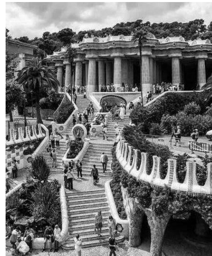
Рис 6. Сценографія маршруту вздовж парадних сходів парку Гуель. Барселона. Архітектор Антоніо Гауді. Дата заснування: 1900- 1914 р.

Отже, можна стверджувати, що емоційні і смислові навантаження, які притаманні різним мистецтвам, відіграють вагомую роль в формуванні архітектурних просторів.