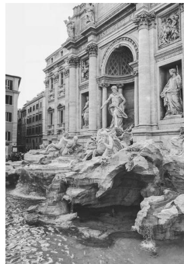
Рис. 4. Фонтан Треві. Рим. Архітектори Нікола Сальві, Джузеппе Панніні. 1735 р.