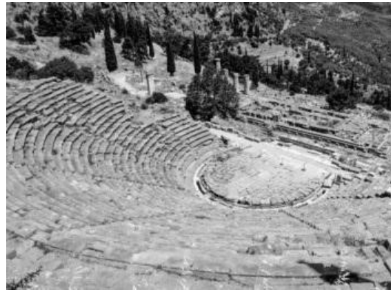
Рис. 2. Театр Аполлона. Дельфи.

https://www.greecevillasrentals.com/5-great-reasons-to-visit-athens-greece