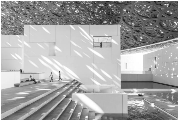
Рис. 7. Двір музею Лувр. Абу-Дабі. Архітектор Жан Нувель. 2017 р. https://www.archdaily.com/883202/jean-nouvel-louvre-abu-dhabi-photographed-by-laurian-ghinitoiu

Розподілення уваги відвідувача, як на експонати, так і на архітектурно-просторові прийоми, які породжують різні стани, створює певну динаміку у сприйнятті. Це, в свою чергу, спонукає контактувати з музеєм на особистий розсуд. Людина має вибір вивчати мистецтво, споглядати експозиційні зали, брати участь в інтерактивних виставках, насолоджуватися атмосферами просторів, що приваблює відвідувача бути причетним до культурного життя. Однозначно можна стверджувати, що досвід, який переживає людина в такому просторі є унікальним, що формує нове відношення до мистецтва і культури в цілому.