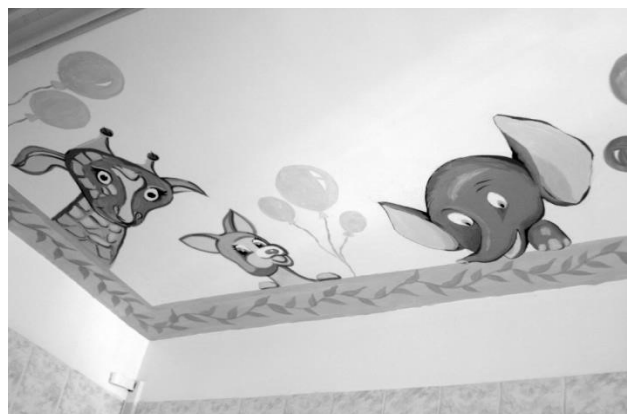
Рис. 2. Розпис стелі приміщень реанімації Національної дитячої спеціалізованої лікарні "Охматдит", м. Київ. Робота студентів та викладачів арх. факультету, кафедри ДАС