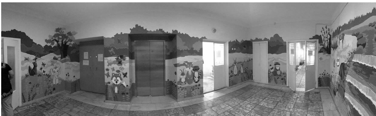
Рис. 1. Розпис стін типу "суцільна заливка". Хірургічний корпус Національної дитячої спеціалізованої лікарні "Охматдит", м. Київ. Робота студентів та викладачів архітектурного факультету, кафедри ДАС та ІТА