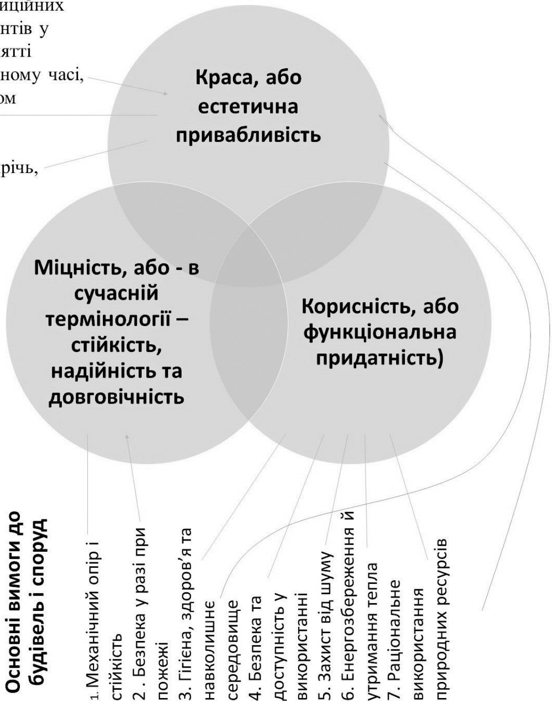
Рис.2 Напрямки використання сценарних методів в проектуванні об'єктів архітектури.

послідовність важливих композиційних фрагментів у сприйнятті в реальному часі, протягом року, або десятиріччя,